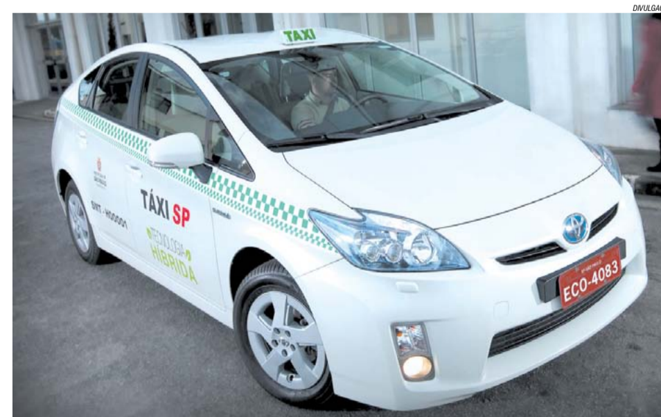
Prius, carro híbrido produzido pela Toyota, já são utilizados na nova frota de táxi em São Paulo

Além disso, a nova lei permite ainda que a Secretaria