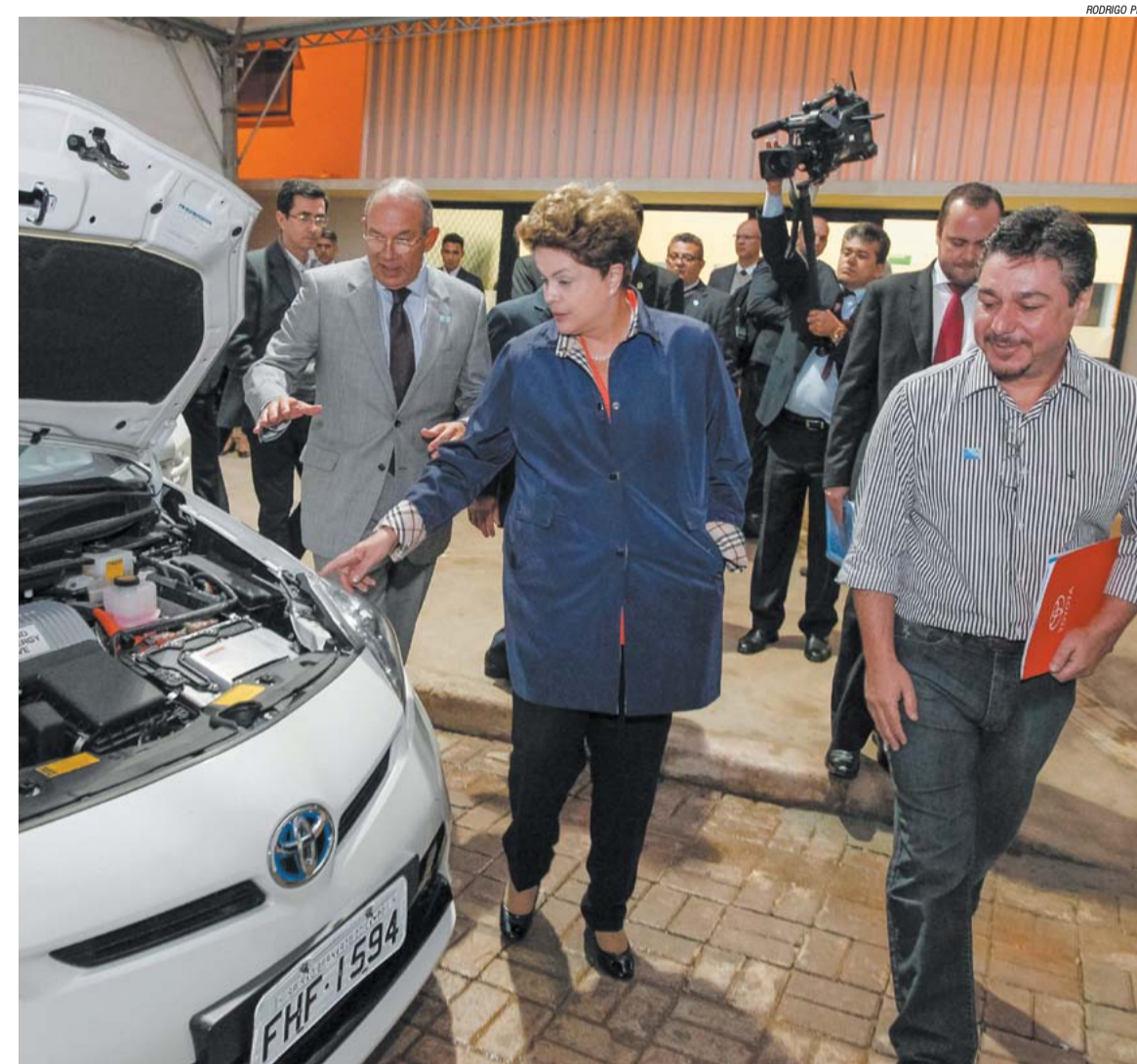
Sindicato acredita que a produção na região de veículos que funcionem com etanol ou gasolina e energia elétrica trarão ao País tecnologia do futuro. Após receber documento, presidenta examinou um Prius, híbrido produzido pela Toyota

RM – Uma política de incentivos. Dentro do novo Regime Automotivo, o Inovar-Auto, que estamos cons-