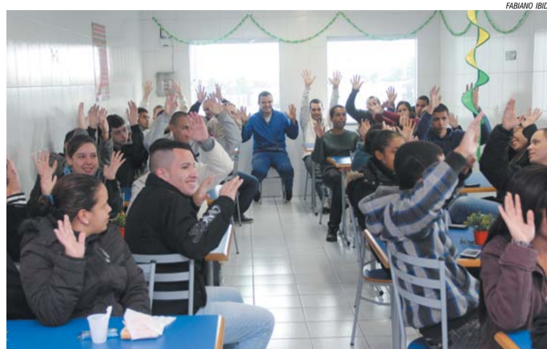
Trabalhadores na Quantum

"O objetivo é estreitar ainda mais as relações com a empresa para que os próximos diálogos sejam ainda mais promissores e possamos alcançar resultados cada vez melhores", destacou.