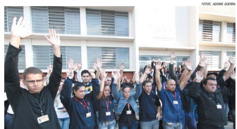
Assembleia realizada na Fiamm

Já na Fiamm , os trabalhadores aprovaram a proposta durante assembleia à tarde, no pátio da fábrica. O pagamento será feito em duas vezes, a primeira em julho deste ano e a segunda em janeiro de 2015.